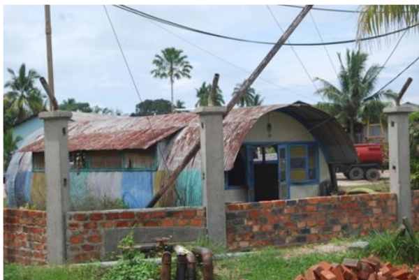
Gambar 1 Rumah Pegawai BPM

MS 9 pt. Gambar dimuat dalam format file .jpg, .jpeg, atau .tif, dengan resolusi maksimal 150 dpi.